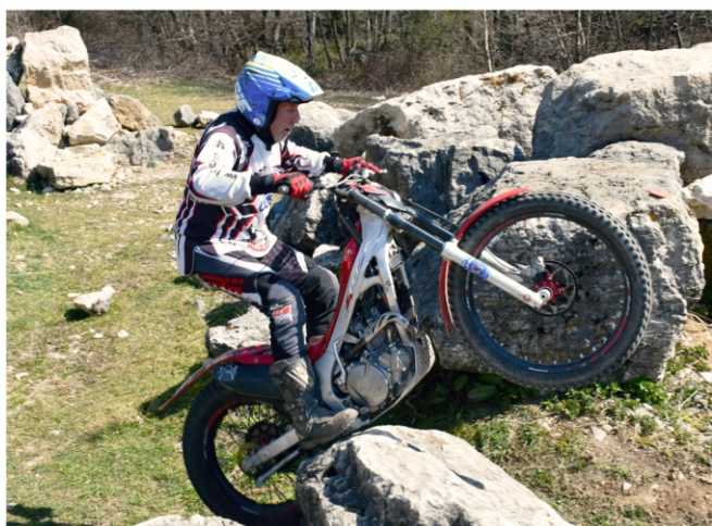
Waltou en action

30 mars: camp FMS à Bassecourt, l'occasion de se remettre en jambe... sans poser les pieds !