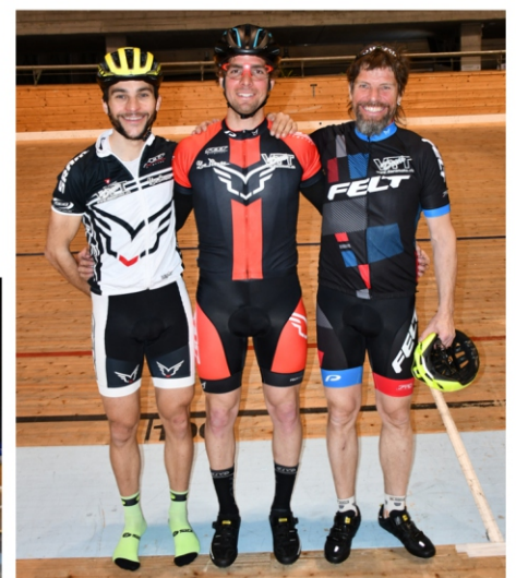
le podium du tour chronométré