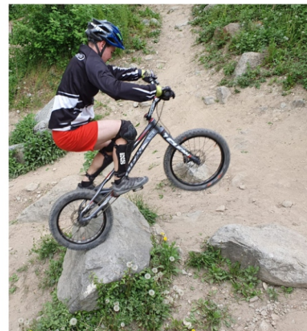
Le terrain de Fully est idéal pour tous les niveaux