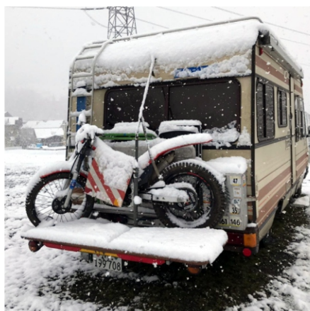
Waltou arrive à Savièse, un vrai temps pour le Trial !