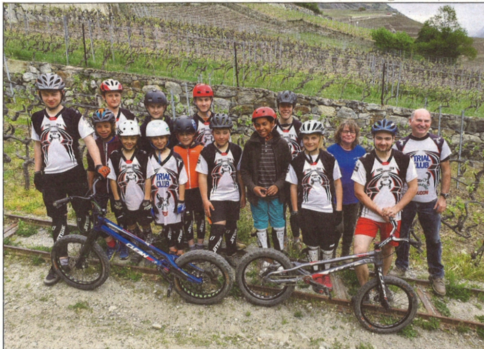
Les participants au camp 2019

• C'est par un temps ensoleillé que 14 coureurs du TCPM de Moudon se sont donné rendez-vous mardi 23 avril au local de Vuiliens pour embarquer dans un mini-bus avec remorque direction le Valais pour participer au traditionnel camp d'entraînement de printemps destiné à préparer au mieux la saison à venir.