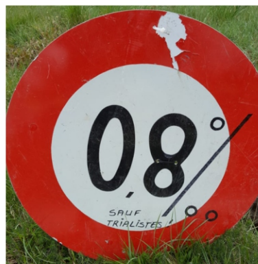
28 avril - Trial de Savièse

Brian 1er en Expert et Waltou 2ème en Fun, bravo !