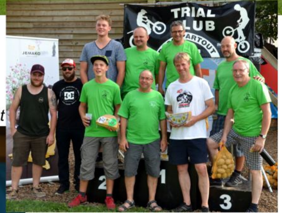
Savièse, prix du plus grand Team