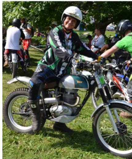
les coureurs sont prêts au départ