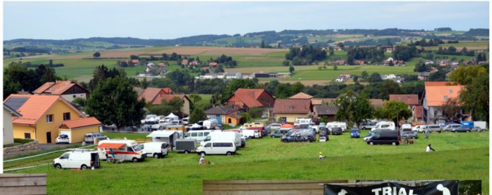
le parc coureurs