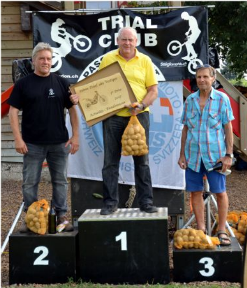
podium des "Actuelles - Rando"