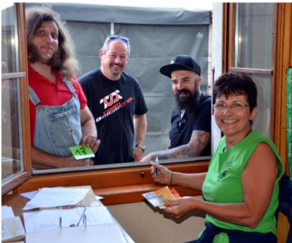
samedi, inscription au bureau