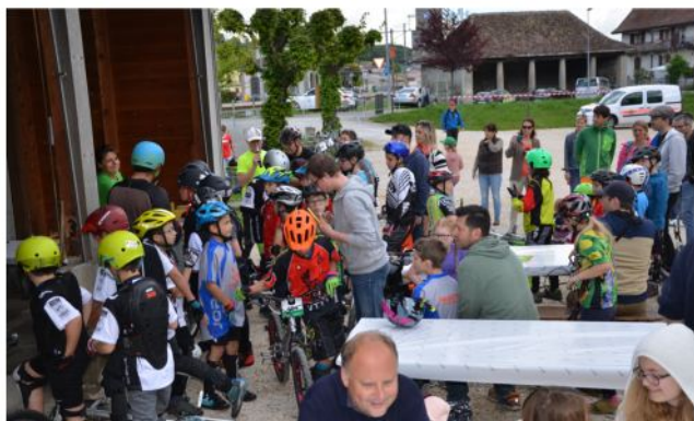
au moment du départ