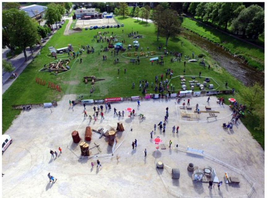
vue prise par lan avec son drône