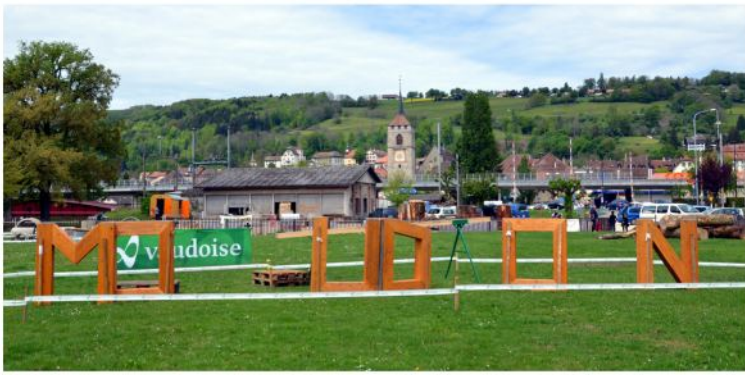
L'ancienne Place d'Armes, un lieu idéal