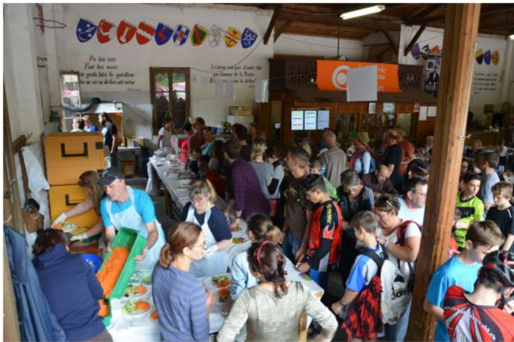
vue côté cuisine