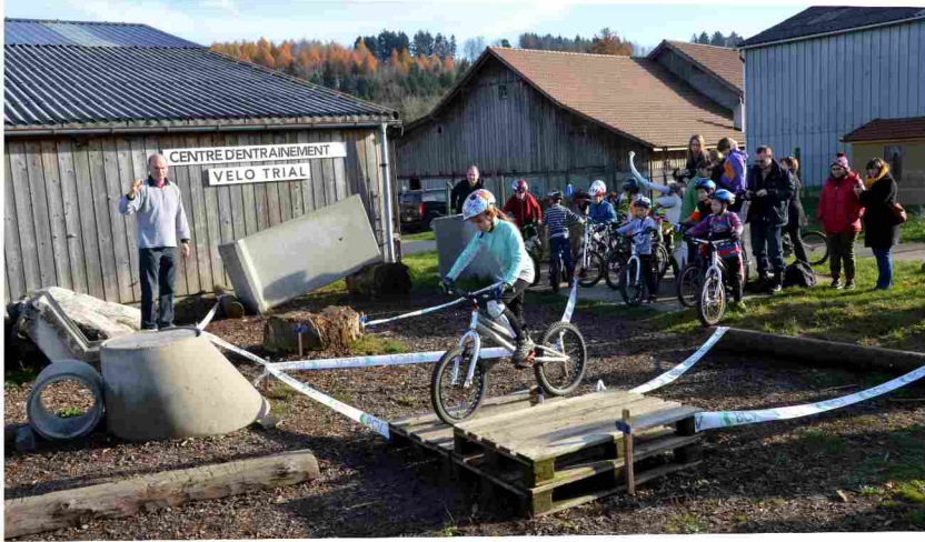
belle météo, 29 participants 2 entraîneurs, zones dans la halle et dehors