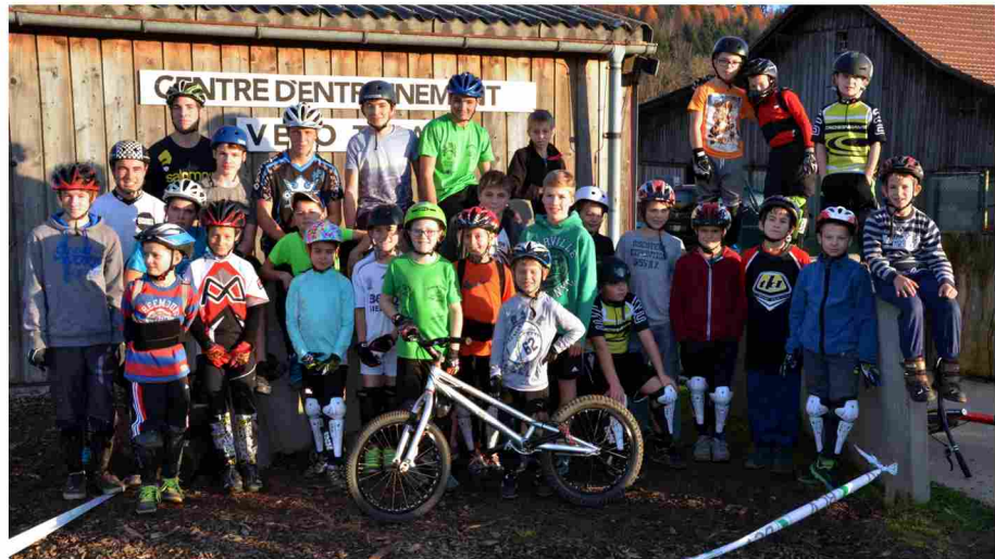
29 nov : concours interne moto