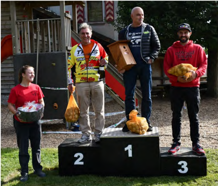
Podium des motos Actuelles Experts