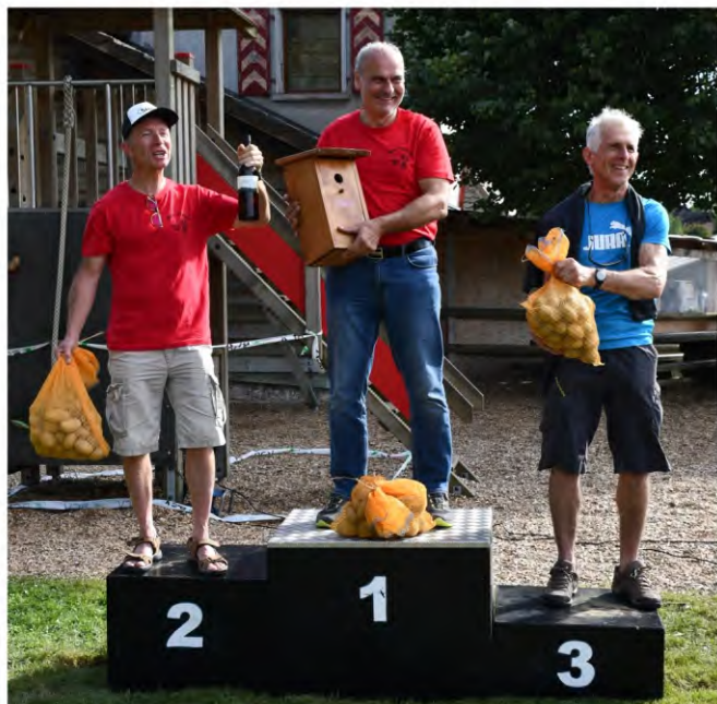
Podium Vestiges Experts