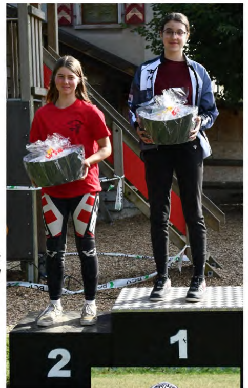
Bravo les filles !